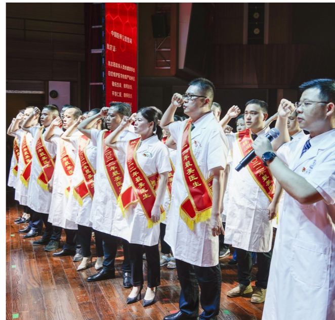
▲获奖的“最美医生”在宣誓。