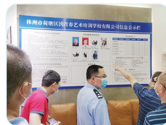
执法人员核对培训学校相关信息。

7月19日,茶陵县教育局、市场监督管理局、文旅广电局联合开展了校外培训机构执法检查行动,对违法违规校外培训机构进行了查处。同日,渌口区教育局也开展了联合执法检查行动,共下达2份停办通知书,1份整改通知书。