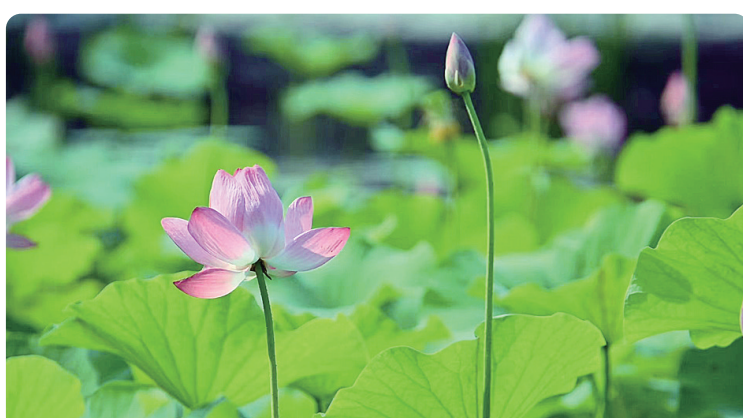
仙庠岭下荷花艳。