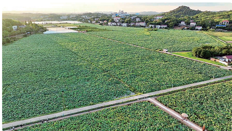
仙庠岭下的万亩荷塘。