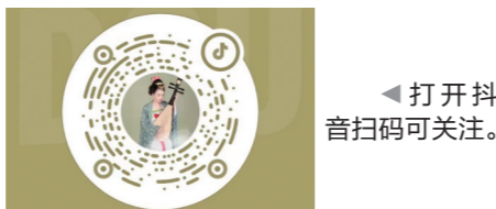
▶打开抖音扫码可关注。