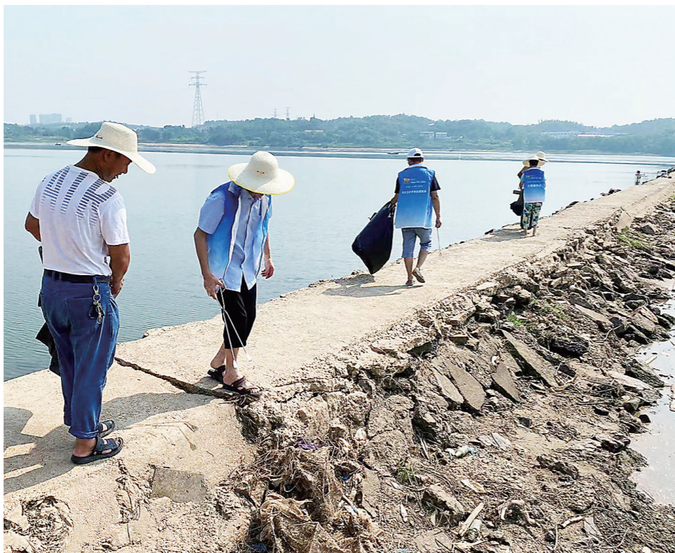
群丰镇党员干部、志愿者化身“水域美容师”，用汗水守护碧波。

株洲日报讯(全媒体记者/杨如 通讯员/彭杰) 8月8日中午时分,烈日下的河面,像一面明晃晃的镜子,照得人睁不开眼。来自天元区群丰镇的党员干部、志愿者以及保洁公司工作人员等30多人,化身“水域美容师”——清除河面的漂浮物、清扫河岸的垃圾,用汗水守护这片碧波。 当天一大早,这些“水域美容师”,带着火钳、锄头、扫帚等工具,沿着湘江水域岸线,将存留在河道岸线以及汛后残留在河道内的泡沫、塑料垃圾等进行集中清理,并及时转运。汗珠顺着他们的脸颊、脖子往下流,后背的衣服被汗水浸湿,挂在脖子上擦汗的毛巾,也已经湿透。半天时间,河道面貌焕然一新。