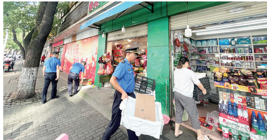
▲人民路沿线，城管队员协助商户将占道摆放的商品放回店内。

本报讯(株洲晚报融媒体记者/伍靖雯)8月8日，由市创文办牵头组织，市城管局、市公安局交警支队、市文旅广体局、市市场监管局、市交通局等部门开展联合执法，在交通早高峰、晚高峰期间，对人民中路、建设南路及株洲火车站周边等区域的占道经营、车辆违停等问题进行劝导和执法，提升文明城市水平。