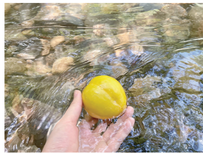
▲溪水就像免费的水箱,水果往水里泡上几分钟,冰凉解渴。

大概两小时,一路逆流而上,我们到达了终点。此时,瀑布飞流直下,寻溪溯源,身心得到满足。