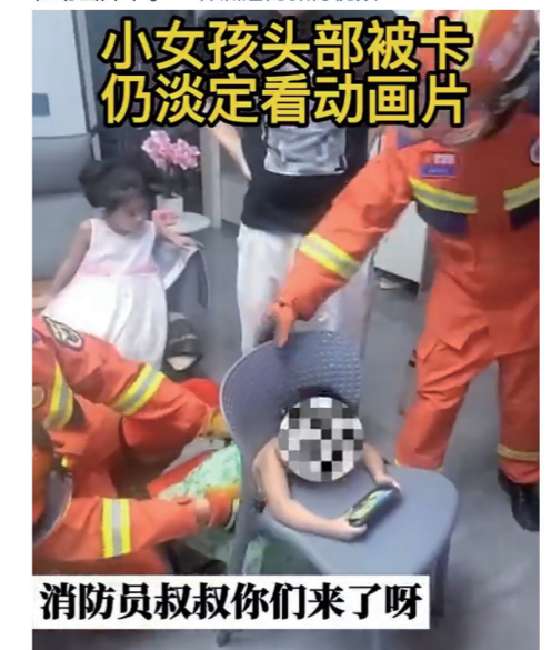
小女孩头部被卡仍淡定看动画片 消防员叔叔你们来了呀 近日,株洲一萌娃玩耍时不慎将小脑瓜卡进椅背空隙,家长施救未果心急报警。消防员赶到后,见小家伙正歪着小脑瓜趴在凳子上看动画片。为孩子做好防护后,消防员顺利破拆椅背,帮娃脱困。获得自由的小萌娃继续接过手机,沉浸在动画片中。

株洲魅# 22-8-6 09:06 来自 微博视频号 发布于 湖南 #株洲城事# 【株洲#卡头萌娃淡定趴椅子上看动画片#】近日,株洲一萌娃玩耍时不慎将小脑瓜卡进椅背空隙,家长施救未果心急报警。消防员赶到,见小家伙正歪着小脑瓜趴在凳子上看动画片,这场面好不惬意,为孩子做好防护后,破拆椅背,帮娃脱困。获得自由的小萌娃赶紧接过手机,继续沉浸在动画片中。 □株洲魅的微博视频