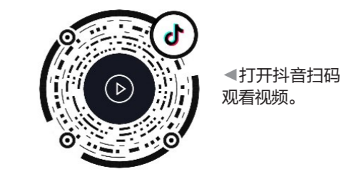
▲打开抖音扫码观看视频。