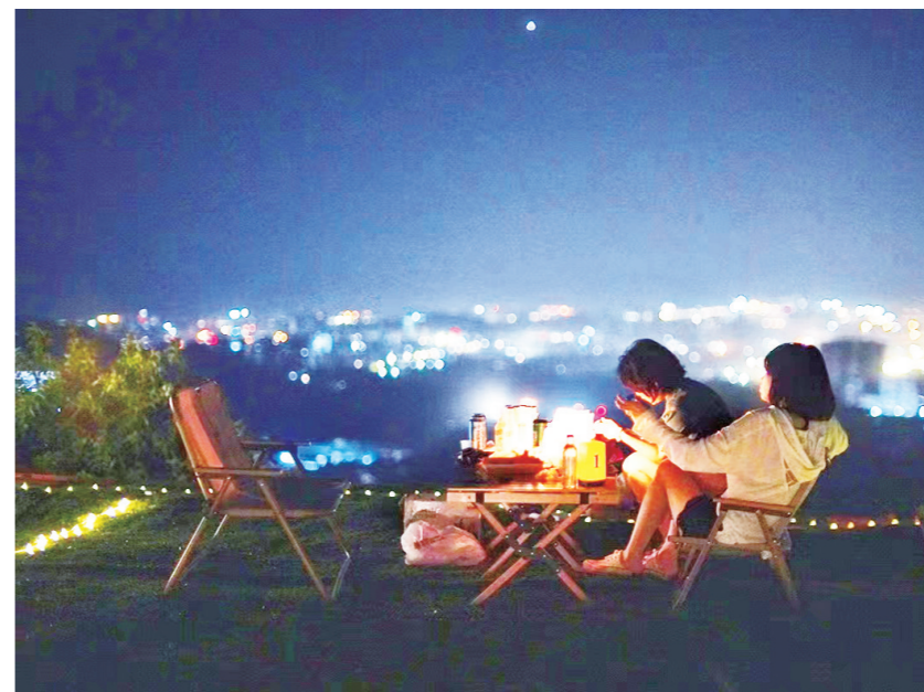
▲夜幕降临,华灯初上,三五好友围坐在石峰区汪家岭山顶露营地,好不惬意。