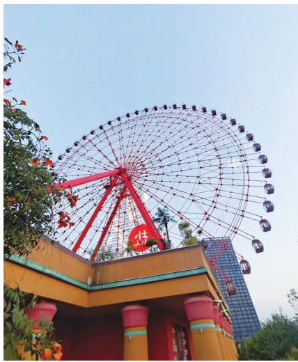
世界之窗摩天轮

暑假期间,女儿跟我说想去海边看看。但是,各地不时出现疫情,真是不敢远行。本想着去云水上乐园“冲浪”替代一下,但她提出去长沙世界之窗。想想我上次去世界之窗还是大学期间,重游一下也好。