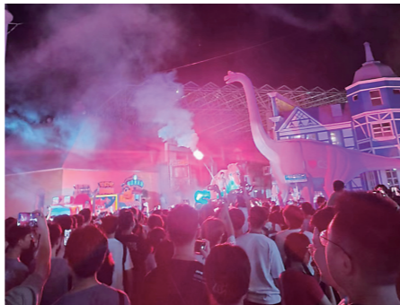
▲电音节开场前的预热表演。

上周,妹妹邀我去长沙看电音节。我对闹闹哄哄的场合不感兴趣,加上到那都得带着女儿,怕她年纪小受不了。只是还没来得及开口拒绝,妹妹就发来一连串请求的表情,说她早就想去看了,只有我能陪她了。顿时觉得自己无比重要,耳根子一软,答应了。