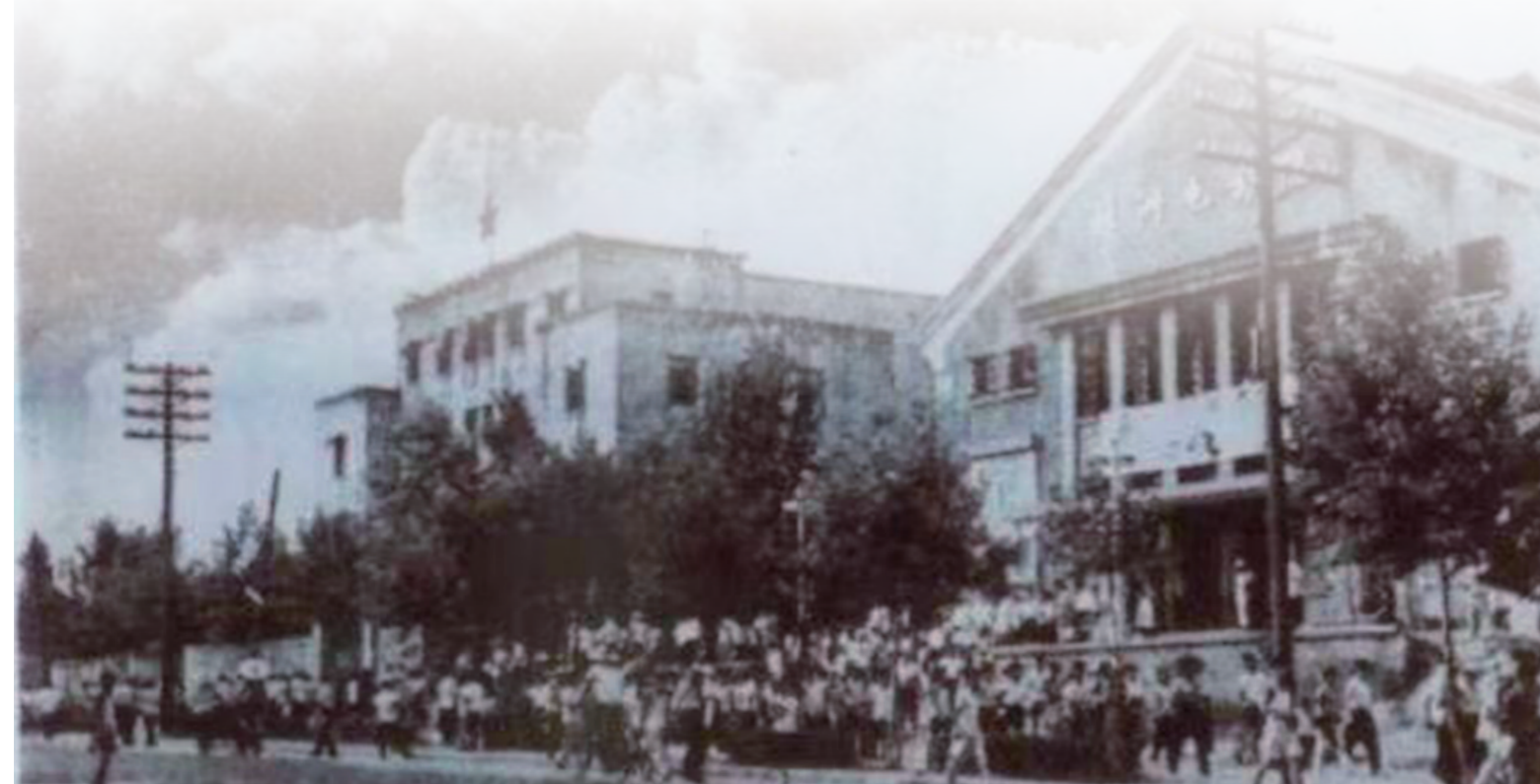
早期的株洲电影院,改制后演变为如今的千金文化广场电影城。