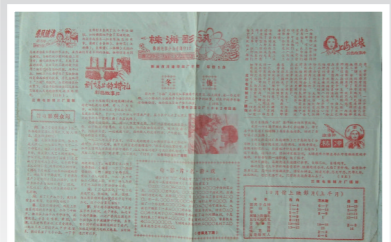
早期的株洲影院。