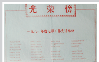
当时,全市不少厂矿企业开设电影院。