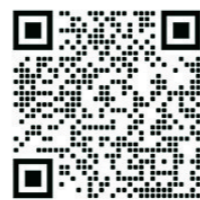
▲打开微信扫二维码可观看视频。