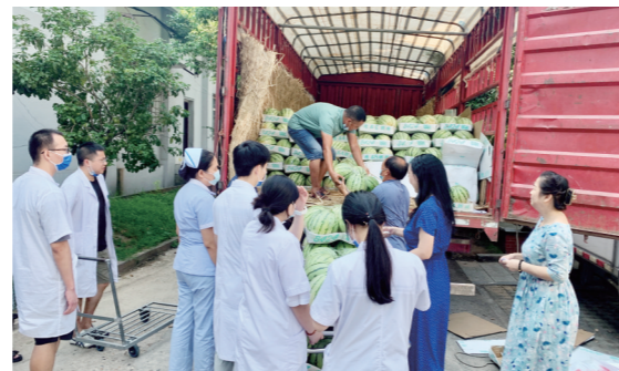
▲市二医院职工领取西瓜。

本报讯(株洲晚报融媒体中心通讯员/刘全会)炎炎夏日,酷暑难熬。作为攸县宁家坪镇自力村的后盾单位,在驻村工作队的对接下,株洲市二医院决定在自力村采购一批西瓜,助力帮扶该村增加集体收入,同时也开展为职工、患者送清凉活动。