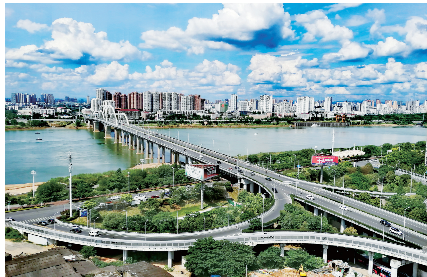
▲今年以来,我市空气质量持续改善。盛夏时节,蓝天白云常在,站在高处远眺,株洲无处不美。图为蓝天白云下的芦淞大桥横跨湘江,颇为壮观。