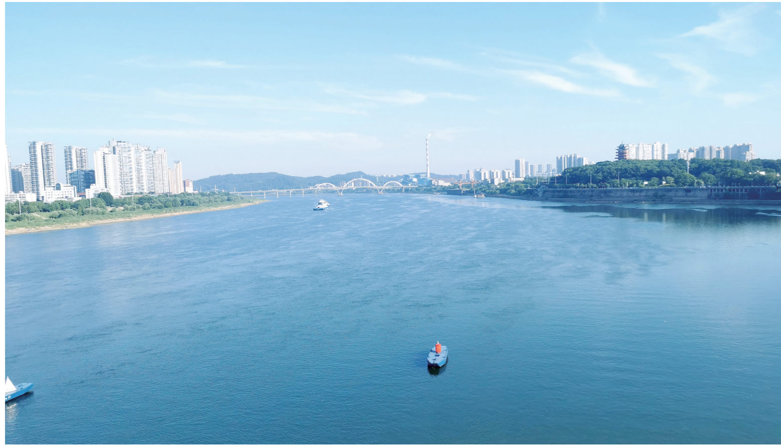
▲一江碧水，悠悠北流，令人心旷神怡。