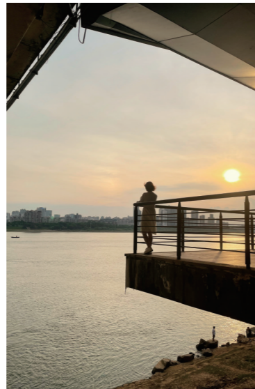
▲在湘江边，一位市民陶醉在夕阳美景中。