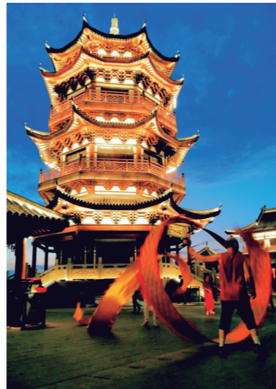
▲近日，傍晚时分，市民在分决亭下舞小龙。

2022' 株洲晚报金秋助学 主办单位：株洲晚报 协办单位：市烟草局(公司) 天元区幸福教育基金会 株洲晚报志愿者联合会