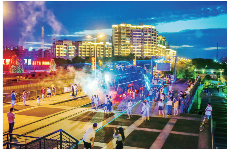
▲仲夏的傍晚，市民们在河西风光带休闲。