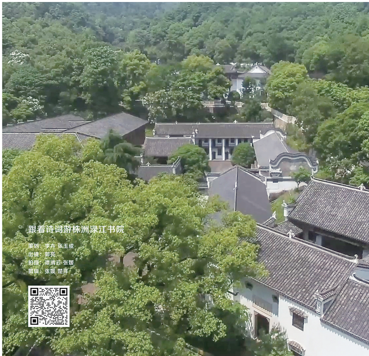
跟着诗词游株洲绿江书院

今年以来,累计交办并整改涉气污染问题300余个;累计查处违规建筑工地并下达整改通知186次;查处渣土车违规行为122起;查处超标排放机动车违法上路行驶行为263起;柴油货车闯禁限行区行为6128台,淘汰老旧车辆9台;处置燃放烟花爆竹警情80余起;落实涉气“夏季攻势”挥发性有机物、工业窑炉治理项目42个,已完成35个,完成率达83%;开展“春雷行动”涉气问题整治61个,已完成45个,完成率达74%;关停砖瓦企业8家。