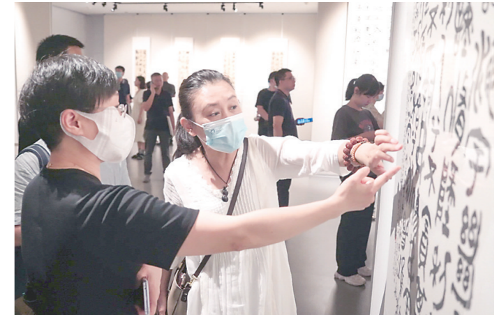
▲市民在参观萧文飞作品。

▲8月3日,“百年之咏——萧文飞书历代咏株洲诗文书法作品邀请展”在株洲美术馆展出。展览由中共株洲市委宣传部、株洲市文化旅游广电体育局、中国艺术研究院书法院、中国国家画院书法篆刻研究所主办。来自全省各地书法家200余人参加了开幕式。萧文飞中学时代曾就读于株洲,是从株洲走出去的书法家。他现为 中国艺术研究院书法院学术部主任。此次展览将展出至9月3日,欢迎广大市民朋友前来参观。