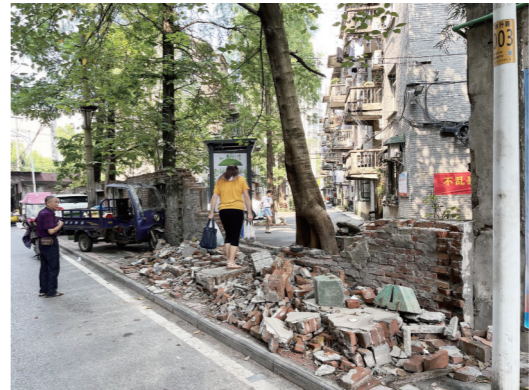
▲围墙推倒后,砖头堆积在人行道上。

“需要砍树。”一名老人指着围墙缺口处一棵曾紧挨围墙生长的大树称,大树树干底部扁平,上方粗壮,遭遇大风天气,有被风吹倒的危险。来园社区居委会工作人员介绍,原麻纺厂的职工宿舍位于来园村;今年5月份,该小区靠华升路路边的围墙出现倾斜后,街道办与湖南华升株洲