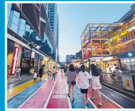
▲大汉·悦中心JOJO街是年轻人夜间休闲娱乐的常去之地。