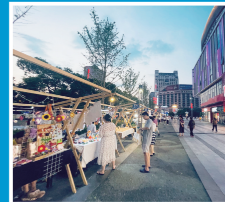
▲未来云MALL外新增了夜间集市。