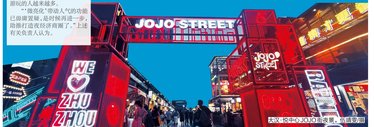
▲大汉·悦中心JOJO街夜景。

目前,我市已有王府井百货、未来云MALL、尚格广场和苏宁广场等商圈运营方制定了夜经济提升方案,共同参与“微亮化”项目。按照我市的规划,今年10月前后,我市要推出4-5个夜经济示范点。 不过,也有业内人士提醒,发展夜经济势必要对“烟火气”有更多的包容,比如适度允许居民自发营造休闲娱乐的氛围,如摆摊设档等,相对于“一刀切”式的收紧或松散,更应该做好环卫基础设施配备和宣传引导,“轻松娱乐的氛围有了,一些观望的商家也会跟进,待形成一定热度后逐步吸引更多消费群体,形成良性循环。” 业内有个说法:白天的消费主要满足基本生存需求,夜间消费更多是满足精神需求。 长期观察株洲的业内人士分析认为,株洲的制造业发达,众多的厂区型社区不仅有消费潜力,还有打造株洲特色夜间消费场景的基因潜力。可以通过“微亮化”将之串联成链形成联动,并在每个不同的厂区型社区,推出具有工业特色的夜间艺术空间、后备箱市集等项目,激发年轻群体对工业株洲的好奇心,并策划推出夜游、夜跑等活动,吸引品牌进驻,提升区域知名度,带动更多消费群体前往。