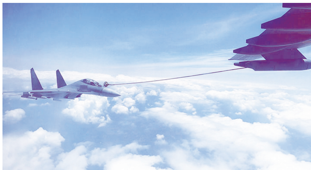
空军运油-20和歼-16飞机开展海上方向空中加油训练(资料照片)。

新华社北京7月31日电 空军新闻发言人申进科7月31日在空军航空开放活动暨长春航空展新闻发布会上介绍,近日,空军运油-20和歼-16飞机开展了海上方向空中加油训练,提高了实战化训练水平。