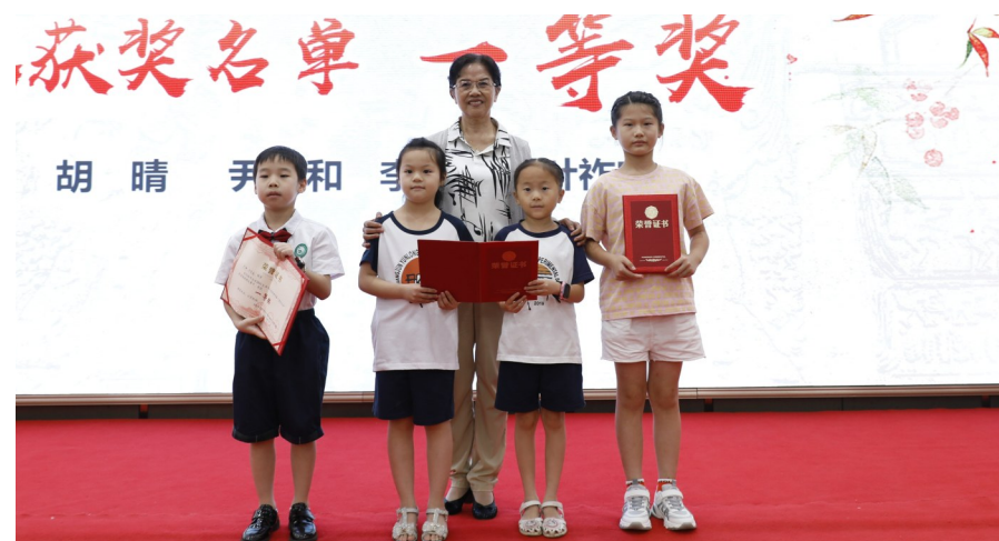
▲“童说炎帝”抖音短视频大赛颁奖仪式。

本报讯(株洲晚报融媒体中心记者/叶新福 通讯员/曹浩泓)7月29日,湖南神农炎帝研究会年会在株洲召开。现场举行“童说炎帝——炎帝故事我来学”抖音短视频大赛颁奖仪式。