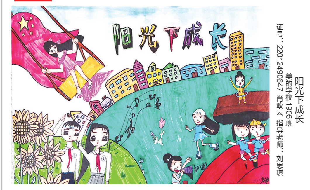
阳光下成长 美溢学校1905班 指导老师:刘思琪