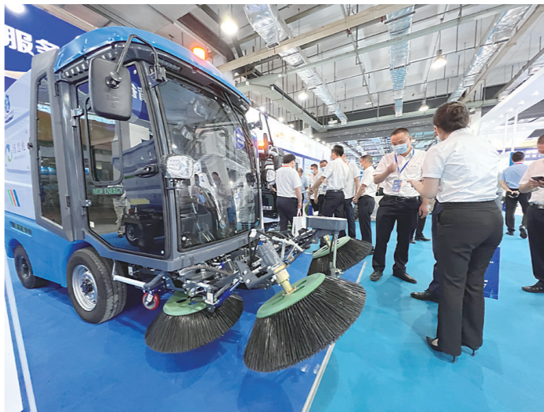
▲纽恩驰为本次展会准备的新型纯电动清扫机。

本报讯(株洲晚报融媒体中心记者/张威)7月29日,2022年湖南城乡环境基础设施建设产业博览会在长沙开幕。来自株洲的纽恩驰、仁仁洁、南方阀门、完全科技等多家企业齐齐