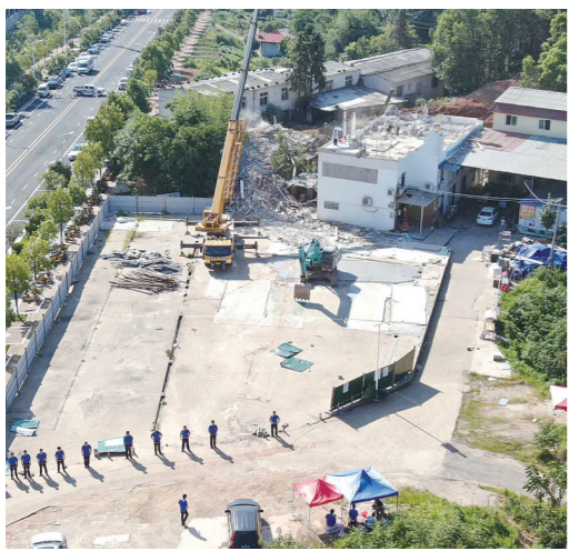
图为拆违现场。

自5月10日我市居民自建房专项整治活动开展以来,株洲经开区共拆除违建房屋54处,面积达15668.6平方米。下一步,该区域将进一步加大对重点区域的整治拆除力度,力争在8月31日之前全面完成拆违保安“百日攻坚”行动第一批拆违任务,确保该项工作安全有序推进,整治拆除到位。