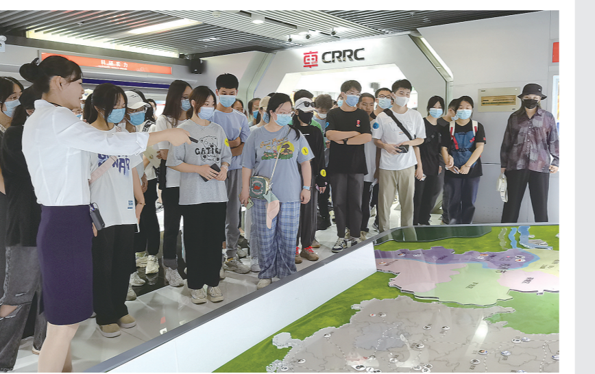
大学生走进中车株机、中车株洲所等企业参观学习。

株洲日报讯(全媒体记者/文樱 通讯员/刘磊)近日,我市开展“走进制造名城,畅享幸福株洲”暑期大学生大厂大所株洲工业学习实践活动,分批组织370名大学生深入株洲全球先进制造业龙头企业,近距离感受株洲速度、株洲高度、株洲硬度。