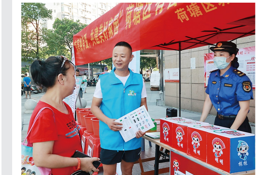
活动中,志愿者正在向市民普及有害垃圾相关知识。

荷塘区城管局相关负责人表示,该区持续推进垃圾分类制度化、常态化、长效化,抓住投放、收集、运输、处理、回收利用等关键环节,促进生活垃圾减量化、资源化、无害化,力争实现经济、社会、生态效益共赢;同时开展系列创新活动,制定完善规章制度,鼓励广大群众投身垃圾分类行动,让垃圾分类走进千家万户。