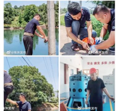
▲烈日下的坚守。

株洲发布 22-7-26 13:22 中共株洲市委网信办官方微博 #烈日下的坚守# 当前持续的高温天气正值水稻灌溉需求高峰期,株洲市酒埠江灌区的水利人头顶烈日、战高温、斗酷暑,以确保灌区的52万亩水稻得到充分的灌溉。