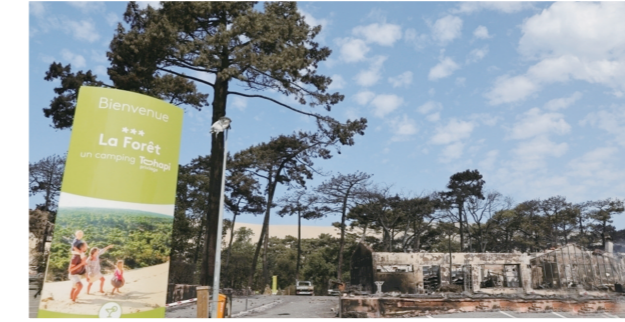
▲法国吉伦特省波尔多郊外,当地森林大火持续蔓延,比拉沙丘的露营地被烧毁。