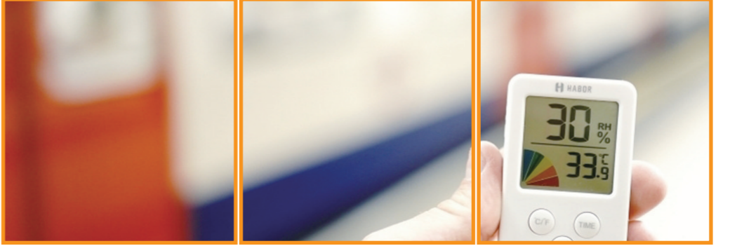
▲即便是在地铁里也不凉快。拿着温度计站在伦敦地铁里,数字显示为33.9摄氏度。

近日,欧洲多地相继进入“高烤”时间,气温纷纷创下纪录。世界气象组织(WMO)表示,像本次欧洲这样的极端高温天气未来将频繁出现,且这一气候恶化趋势将至少持续到2060年。 极端高温天气不仅引发欧洲地区多起山火,铁轨扭曲、机场跑道融化、河道晒干等情况也伴随发生。据悉,长达数日的“炙烤”之下,中暑甚至死亡的人数不断上升。 (据中新社)