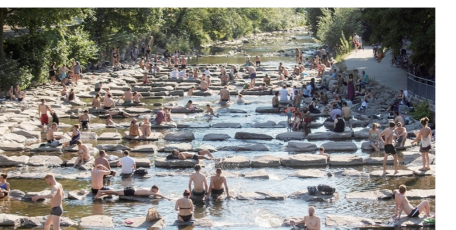
▲德国一条顺势而下的河流里坐满了乘凉的人群。