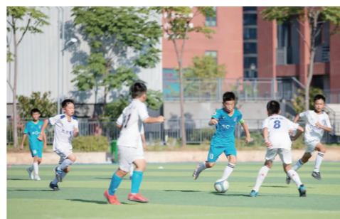
▲足球小将在绿茵场激烈比拼。

本报讯(株洲晚报融媒体记者/王晖)7月25日,2022年株洲市第一届全国青少年校园足球特色学校足球联赛在市二中初中部圆满落幕。本次比赛共有来自各县市区的39支全国青少年校园足球特色学校球队参加。经过激烈比拼,九方中学、北京师范大学株洲附属学校、十九中、九方小学、六〇一中英文小学分获男子高中、男子初中、女子初中、男子小学、女子小学对应组别的冠军。