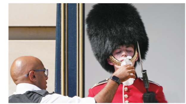
▲在气温首次突破40摄氏度导致火灾激增后,英国首都伦敦于7月19日宣布进入“重大事件”状态。图为女王皇家卫队的成员在高温天气里站岗,工作人员上前给他喂水。