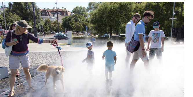
▲7月19日,在匈牙利布达佩斯,人们在一处公共加湿设施享受清凉的喷雾。