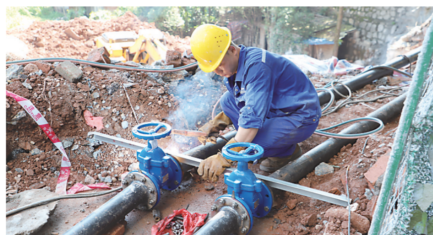
▲抢修人员现场作业,衣服被汗水浸湿。