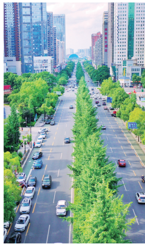
▲庐山路中间的银杏树,给过往的司机朋友送来阵阵凉意。