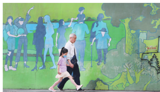
▲田心路文化墙,时尚与工业制造相融合。