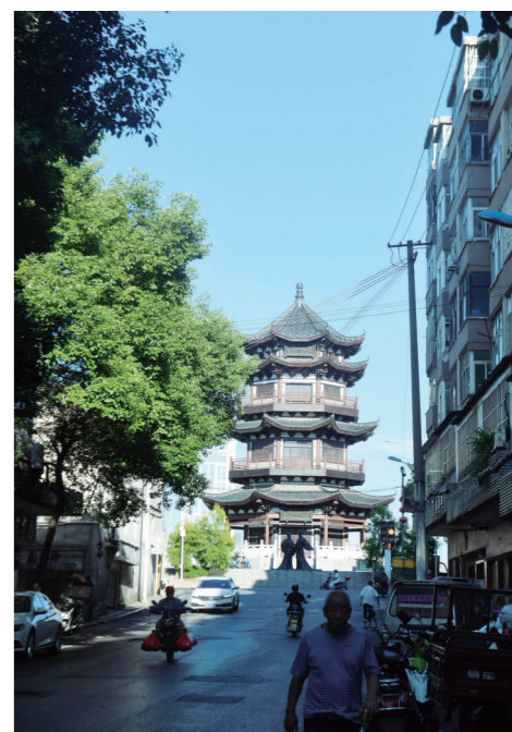
▲解放街西头分袂亭,古代文人在此赠诗离别。

道路是城市的骨骼和血脉,每一条路都印上了城市发展的清晰足迹。时下,城市道路两旁的绿化景观郁郁葱葱,给我们带来了阵阵凉意。人民路,茂密的梧桐树把宽敞的马路包裹得严严实实。夏天,掩映在梧桐树下的人民路绿意盎然,满眼都是绿色。葱葱茏茏的绿色包裹着炎炎酷暑,即使是火辣的阳光穿过无数层翠绿的树叶,也失去了威力。庐山路,绿油油的银杏树呈现出一片欣欣向荣的景象,相比秋天里的妖艳,此时,它正务实地向上生长着。田心路文化墙,展示了中车株机建厂以来修理和制造的典型产品,产品出口国家的建筑以及人物、符号等形态组合创意。充满时尚感的立体文化艺术墙,每当行人经过,和文化墙融为一体时,便能变幻出一幅幅动人的景致。一条条不断延伸的道路,不论是现代风格的新路,还是古朴典雅的老街,都见证着城市建设的嬗变。路,是一座城市峥嵘岁月的光荣与梦想,它蕴藏着城市的灵气、精华和风韵。路,是一个城市驶向未来的航船,它承载着人们对便捷、舒适、美丽交通需求的呼唤。