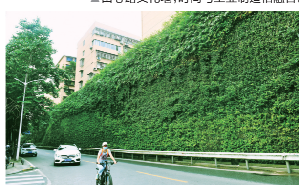
▲恺德路的绿化墙让人叹为观止。