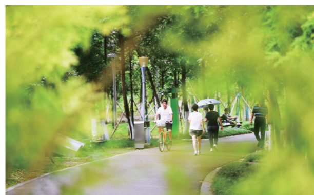
▲湘江风光带林荫道,是市民休闲纳凉的好去处。