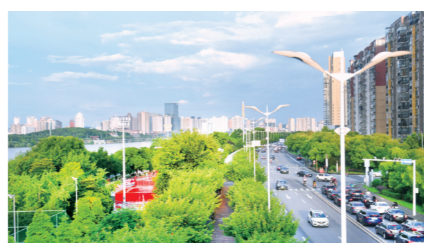
▲河西滨江路,黄绿色的树木把这条路装扮得格外靓丽。