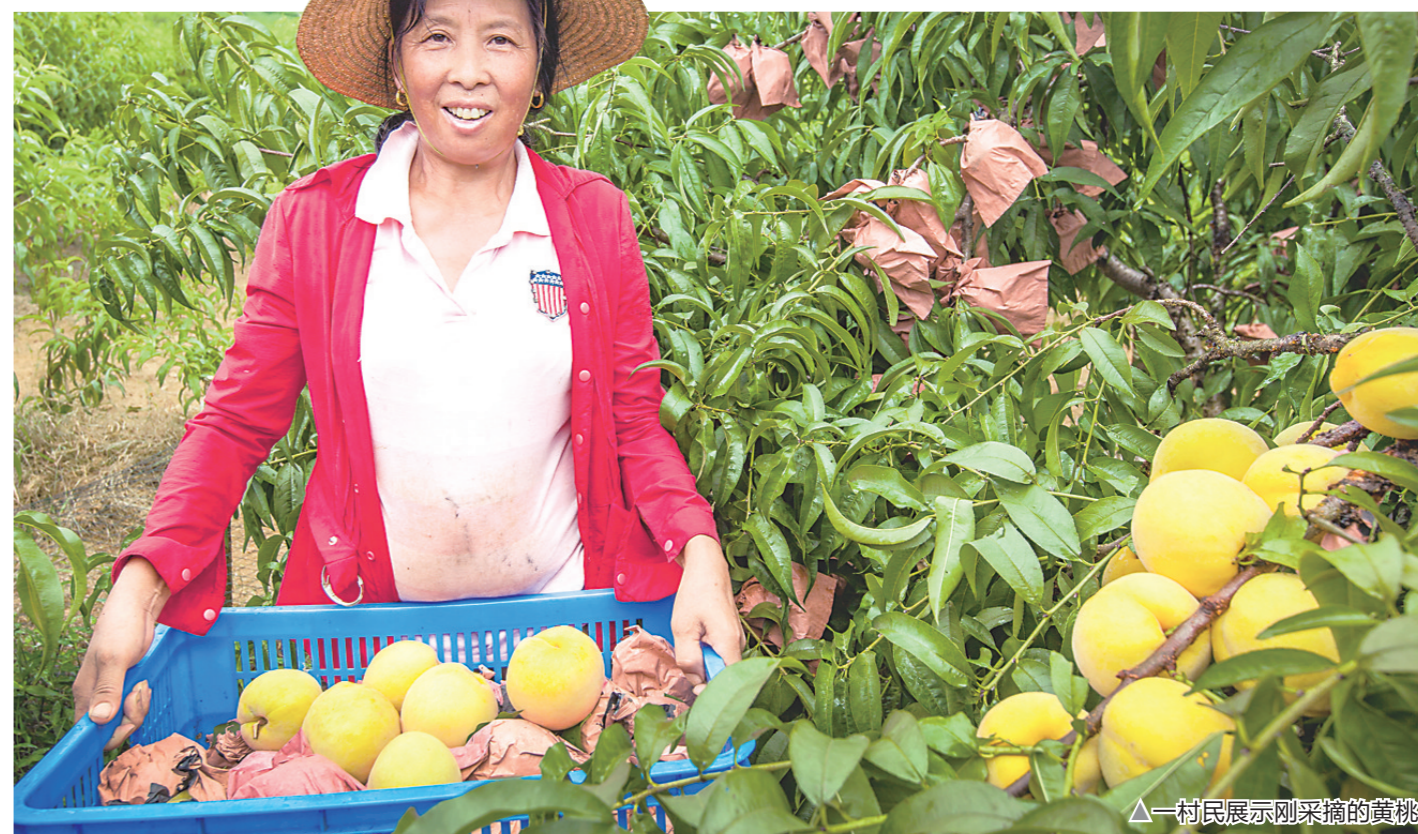
▲一村民展示刚采摘的黄桃。

▲7月21日,炎陵黄桃正式开园上市。在石之坝、黄沙垄等海拔较低的几个村里,果农们穿梭在桃林间,采摘着丰收的喜悦。据悉,炎陵县携手邮政、顺丰、京东等物流企业,完善县乡村三级物流体系,开辟运输专线,确保早上摘桃,消费者下午或次日就能吃桃,让炎陵黄桃卖得更远、运得更快、销得更好。