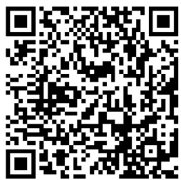
扫二维码可欣赏更多空灵岸美景、了解更多空灵岸传说。

从三圣殿出来，前行不远处便是南山门，东临江岸，西抵峭壁，国务院前副总理方毅题赠的“空灵岸”三字镌于门额，在六月午后的阳光下熠熠生辉。再往前是新建的大雄宝殿，却是在山门之外，也不知有何深意。 我立于其间，江风浩荡，眼前似有许多人影晃动——杜甫来了，驾一叶扁舟，眉头深锁，拈须苦吟，为自己漂泊半生的际遇，也为风雨飘摇的大唐帝国；米芾来了，纵酒狂歌，挥毫泼墨间尽显才气；彭玉麟来了，气度雍容，手掌起落，千军万马都曾听其调度，如今援旗握管，举重若轻处绽放梅花朵朵；唐应涛来了，慈眉善目的老先生，颌首含笑里是血海拼杀后历尽千帆的从容与平淡，或许，还有一丝得偿所愿的解脱……也正因了这些前贤的往来，空灵岸在坎坷而独特地展示它的冷峻和峭拔的同时，亦有了令我这样的庸人俗子所津津乐道的传说与往事，而这，也算是另一种形式的不朽吧！