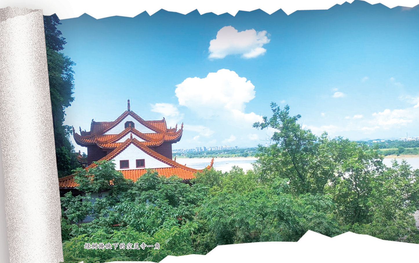
绿树掩映下的空灵寺一角

此刻，三尊鎏金佛像正静静地端坐在佛龕中，一坐观音尊，一坐释迦尊，一坐弥勒尊，皆古拙可赏，斑驳旧迹亦不掩其宝相庄严，隔着玻璃与你对视，人不觉就变得更渺小，俯身跪伏，心香一瓣奉上，不为祈福，亦不求财求禄，只匍匐于这数百年之久的跌宕时光。