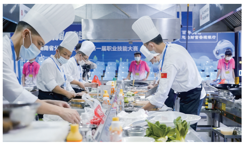
湖南省第一届职业技能大赛比赛现场。

生鸡蛋刻字、叉车叠酒杯、中药切片薄如蝉翼、数控铣精度仅为头发丝的七分之一……7月3日至6日,湖南省第一届职业技能大赛举行,1087名高手在湖南九郎山职教科创城上演了一场技能巅峰对决。在这次湖南规模最大、规格最高的职业技能大赛中,株洲表现抢眼,斩获34块金牌、16块银牌、11块铜牌、金牌数、奖牌数均居第一。其中,金牌数超过了总数的一半,比第二名多28块。此次大赛为何落户株洲?34块金牌背后有哪些故事?……且听知株侠为你一一道来。