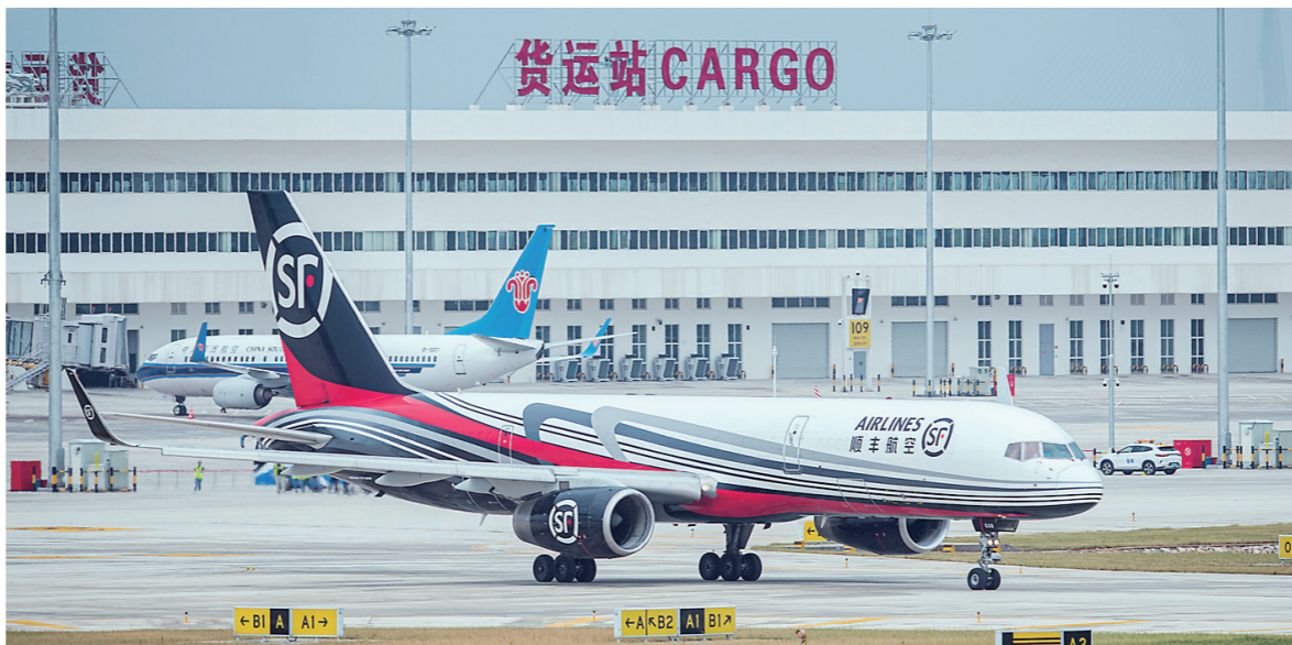
7月17日,顺丰航空的全货机在鄂州花湖机场滑行。

新华社武汉7月17日电 17日上午,一架顺丰航空全货机和一架南方航空客机依次平稳降落在鄂州花湖机场西跑道上。当天,鄂州花湖机场这个我国首个、亚洲首个专业货运枢纽机场正式投运。