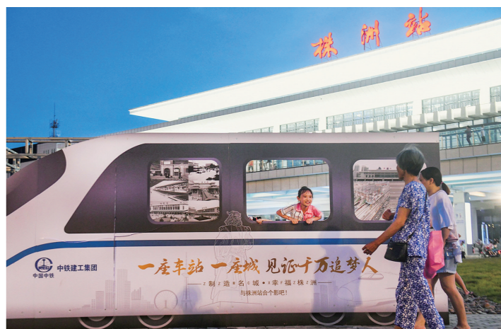
广场上的动车头,供大家尽情地拍照打卡。