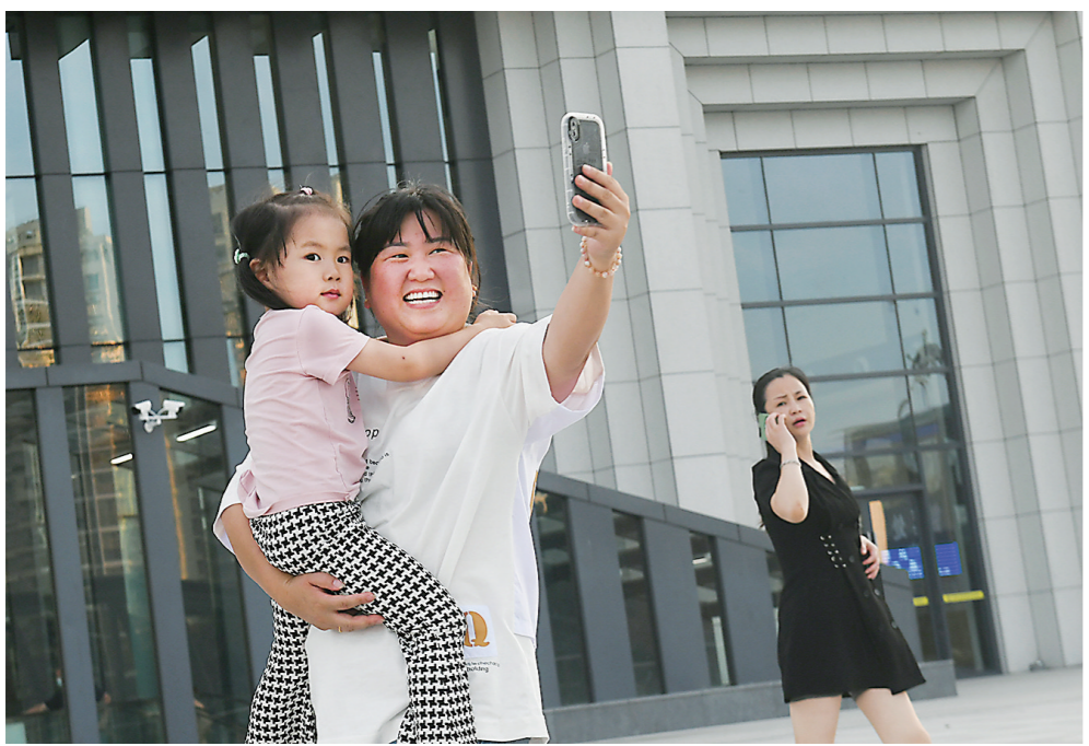
来,和新站房合个影。