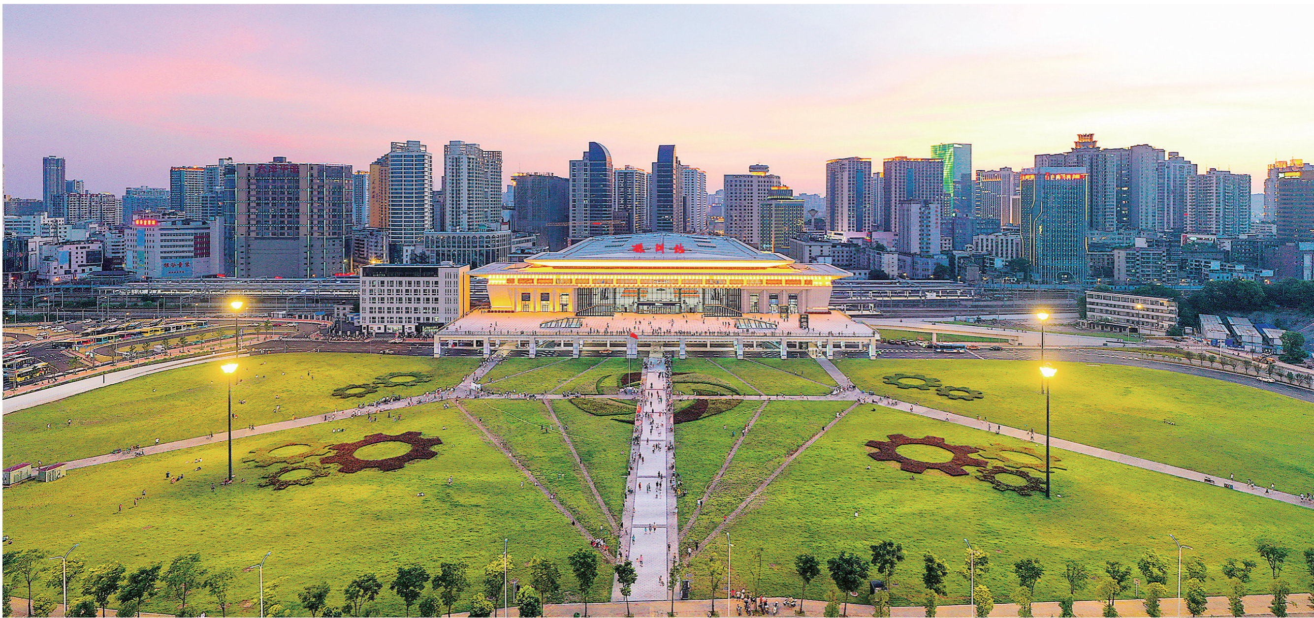
傍晚时分,株洲站东站的夜景分外妖娆。