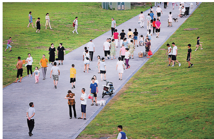
傍晚,来这里散步的市民络绎不绝。