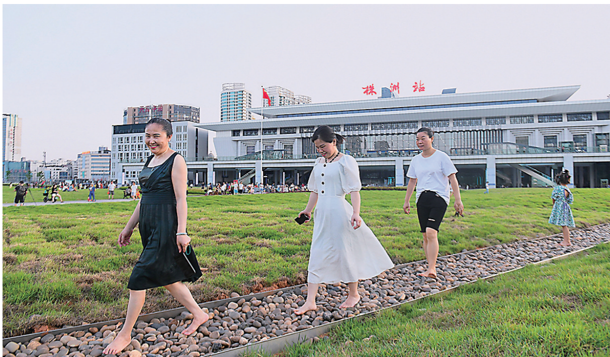
光起脚丫,踩着鹅卵石健身漫步。