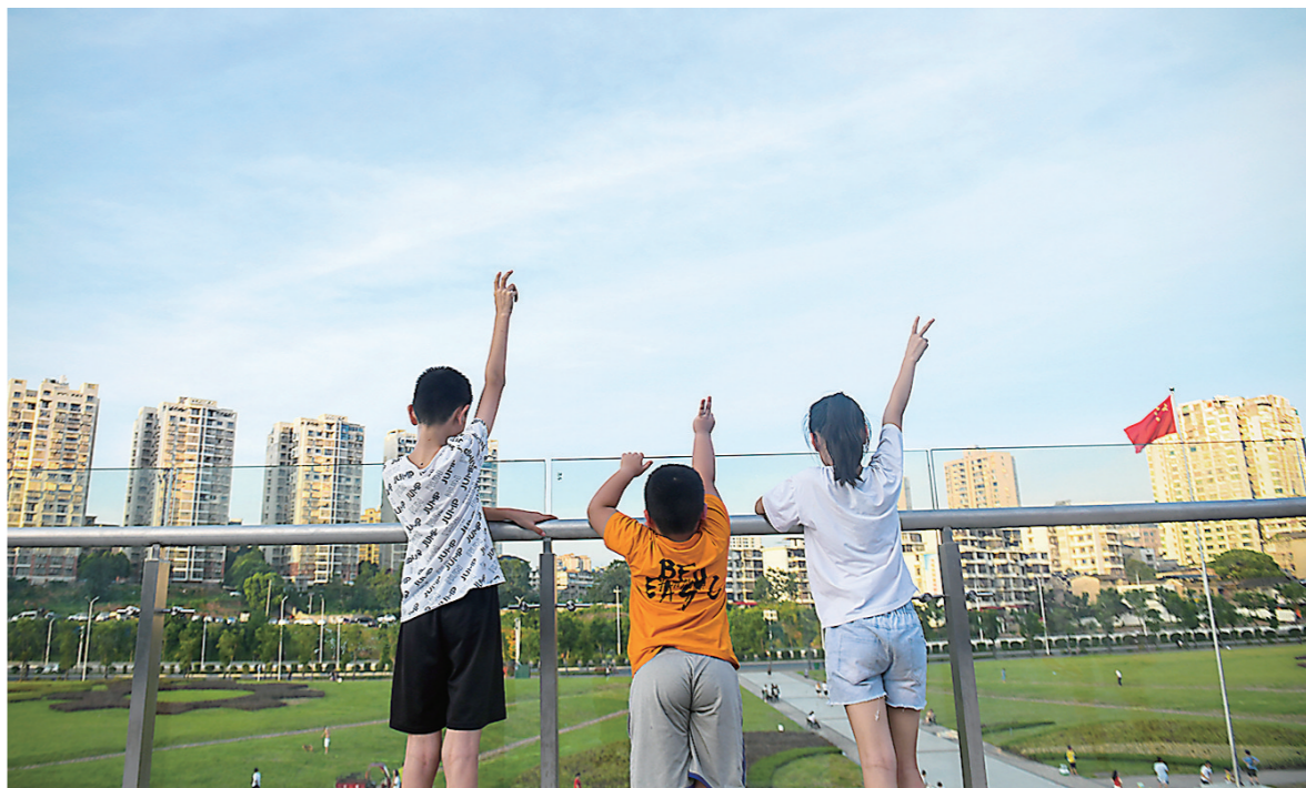
第一次来东站房的小朋友们,兴奋地举手拍照。