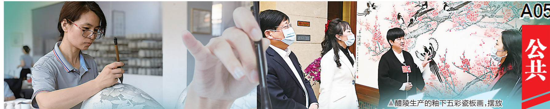
▲湖南省陶瓷研究所内,工艺美术师正在细心彩绘。