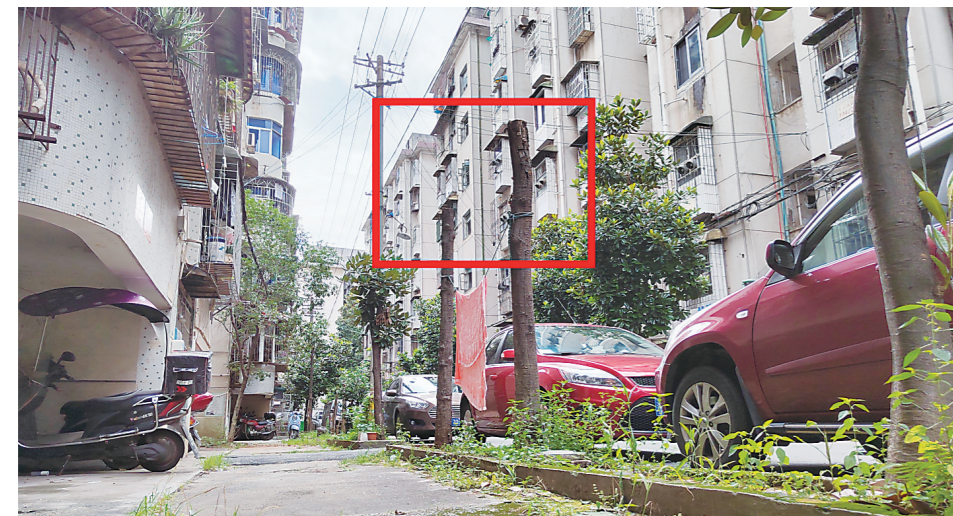
▲东方花园小区至今仍未成活的部分景观树。

本报讯(株洲晚报融媒体记者/易楚瞳)近日,荷塘区东方花园小区业主刘先生向本报反映,该小区约60棵景观树遭“拦腰斩”后,部分树木死亡,至今仍未补栽。他希望,有关部门督促小区业委会妥善处置此事。