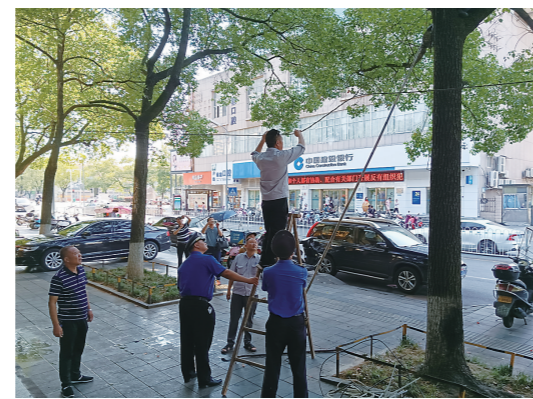
▲芦淞区城管等部门为行道树“松绑”。

另外,我市园林绿化部门也呼吁市民,在行道树上绑扎灯管存在明显安全隐患,不仅会对树皮造成灼伤,也会影响树木“作息”,还望居民共同爱护绿植。