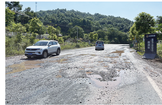
▲S207省道金塘村路段,路面出现破损。

本报讯(株洲晚报融媒体记者/刘平)近日,有多名车主反映,驾车途经荷塘区S207省道金塘村路段时,要格外小心,其中部分路段破损严重,路况较差。