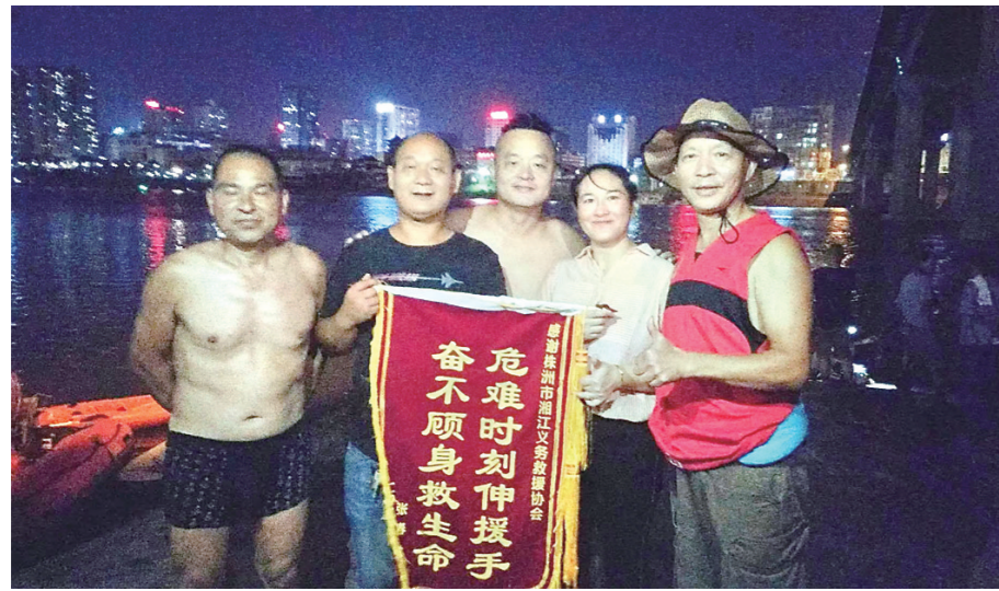
▲湘江义务救援协会部分队员合影。

他们是一群普通的游泳爱好者。救人,这个朴素的信念将他们聚在一起。他们定期在湘江边值守,没有任何报酬,但因为他们的存在,11年时间,一共在湘江里救起128人。他们是湘江义务救援队(湘江义务救援协会),一个以生命践行志愿精神的“草根”群体。