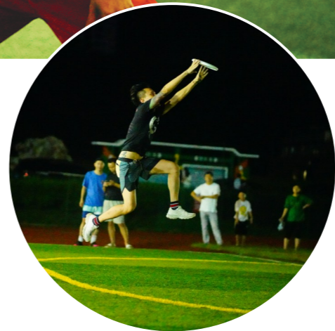
飞盘运动吸引市民驻足观看

《2022年轻人新潮运动报告》显示,有67.19%单身的年轻人希望通过飞盘交友,有趣的是,在恋爱人群中这一比例则相对较低,仅占43.33%。