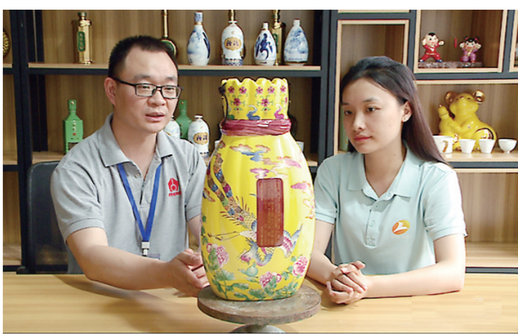
醴陵企业推出的陶瓷文创产品。

醴陵因釉下五彩瓷闻名世界,是“国瓷”“红官窑”所在地、中国陶瓷历史文化名城、中国陶瓷之都。目前,该市有陶瓷企业650家,年产值达740亿元;从业人员近20万人,占全市人口近五分之一。立足打造国家级千亿陶瓷产业集群,全面提高“湘瓷”品牌影响力。