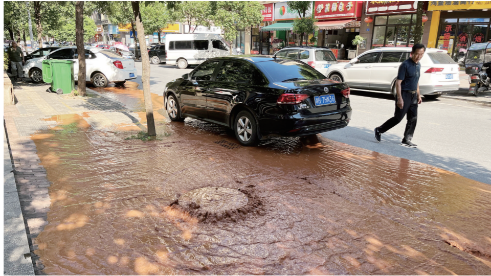
▲人行道上污水井涌出大量泥水。

本报讯(株洲晚报融媒体记者/刘平)7月10日下午,天元区星子坳路金轮·翡翠名园小区路段,人行道上的一处排污井突然喷出泥水,沿着人行道和人行道往低处流,影响交通通行。天元区市政维护中心迅速安排人员到现场处置。 当天下午4时20分左右,有路过星子坳路的市民发现排污井冒泥水现象。市政维护人员到场进行处置,发现排污井冒泥水现象持续到了晚上7时左右,后井中水位下降,水质变清。经查,冒泥水的井口位于缓坡路段,井口附近的管道下游方向出现堵塞,以致泥水从井口冒出。 天元区市政维护中心工作人员与自来水公