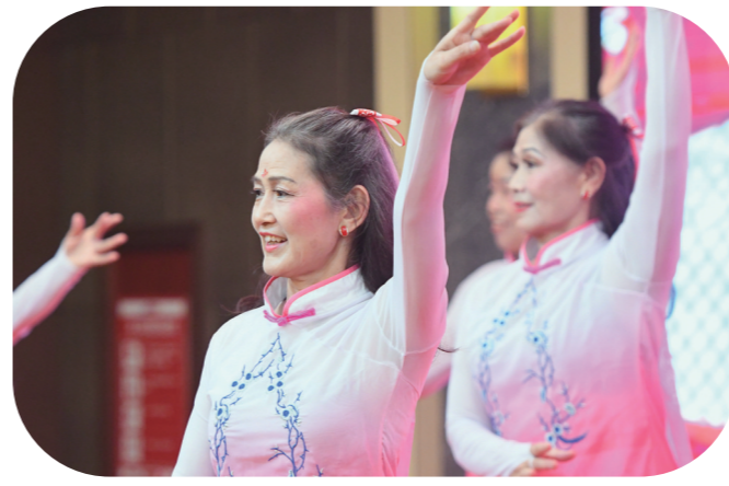
▲大湖塘社区舞蹈队在表演《完疆》。