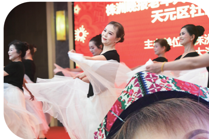
▲形体芭蕾班带来的《我们的生活充满阳光》。