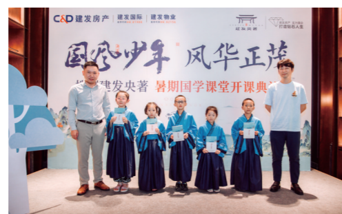
▲学生代表接受入学证书,暑期课堂正式开课。

少年强则国强,中国传统国学文化教育一直以来都是中国教育的重要基石,在全球化的大背景下,教育部门也越来越重视青少年的传统文化教育。今年5月,株洲日报社与株洲建