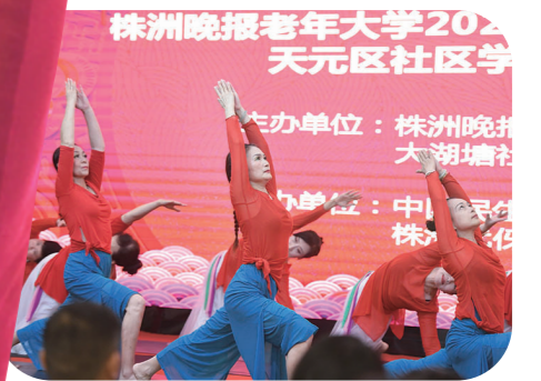
▲舞蹈瑜伽班学员带来的表演《九儿》。