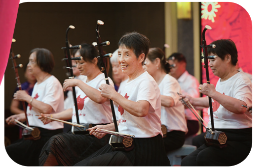
▲二胡班学员在演奏《真的好想你》。