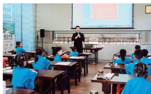
▲孩子们正在上诗词朗诵课。