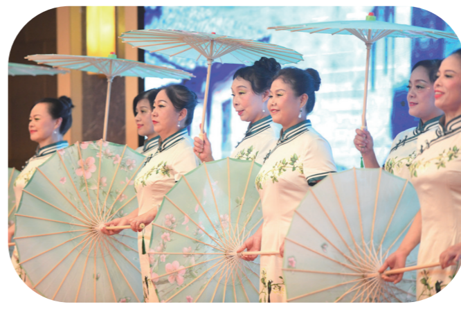
▲旗袍仪态中班学员在表演《水韵江南》。

求知有学处,交流有言处,心情有乐处。为进一步丰富教学内容,去年以来,株洲晚报老年大学创新教育模式,打造了幸福学堂、健康驿站、养老志愿者之家、专家讲堂等4大品牌。同时,开展了户外课堂、研学旅行等活动,构建老有所学,学有所成,成有所乐,乐有所为的老年教学体系。