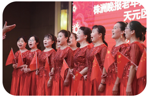
▲合唱班学员们齐唱《我和我的祖国》。