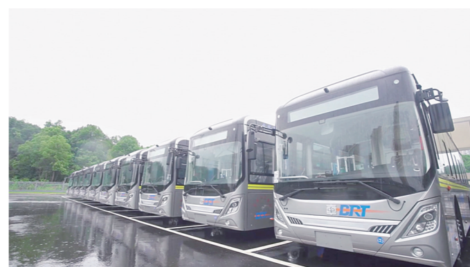
▲中车电动“地铁巴士”备受市场青睐。

本报讯(株洲晚报融媒体中心/高晓燕)近日，湖北宜昌公交运营保障中心正式启用，30辆中车时代电动汽车股份有限公司的“地铁巴士”一并交付使用，助力猇亭区成为宜昌首个实现全域纯电动新能源公交车运行的行政区。