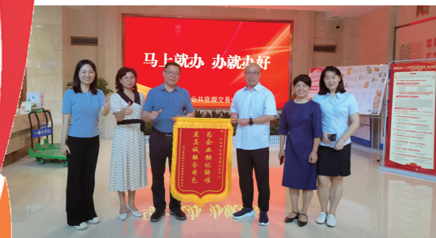
▲6月10日,市公共资源交易中心收到新芦淞集团送来的锦旗。