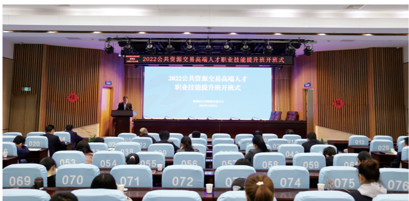
▲4月29日,市公共资源交易中心举办“2022公共资源交易高端人才职业技能提升开班仪式”。

现场,杨泽民就给出了肯定答复。“中心正与市自然资源和规划局进行数据对接,未来会将我市每月的土地挂牌和成交交易情况及时对社会公布。感谢你的建议!”离开交易大厅时,办事人员对株洲市公共资源交易中心的服务速度、温度与态度赞不绝口。“没想到是中心的‘一把手’为我们办挂牌,我觉得体验很棒,不仅办理速度快,杨泽民书记还在第一时间对我们的建议给出了反馈,感到非常暖心。”