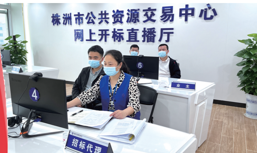
▲5月27日,株洲市某政府采购项目和某工程类项目同时在市公共资源交易中心直播大厅开标。