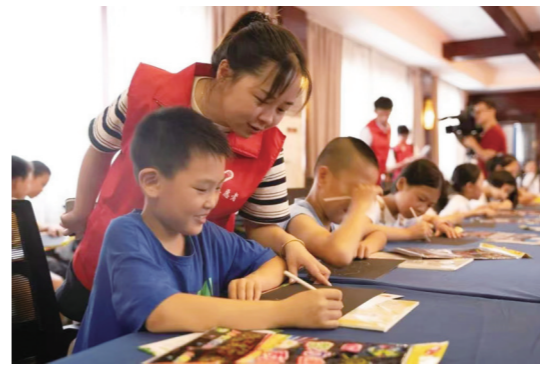
新时代文明实践站里快乐的孩子们。

让科普教育引领未成年人思想道德建设。近日,石峰区“快乐暑假·科技实践”少年科技夏令营举办开营仪式,50多名学生参与,可以进行机器人、无人机编程教学及实践体验,让同学们在动手、动脑中获得成长的快乐。石峰区不老松志愿者服务队、杉木塘小学的党员志愿者共20余人通过“株洲爱心时间银