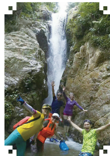
▲旅客在峡谷内嬉戏。

桃源谷民宿位于攸县鸾山镇桃源村,与江西接壤,和井冈山同处罗霄山脉。3年来,虽受疫情影响,接待游客仍达7.8万人次。独具魅力的静谧与清幽,也让游客们流连忘返。