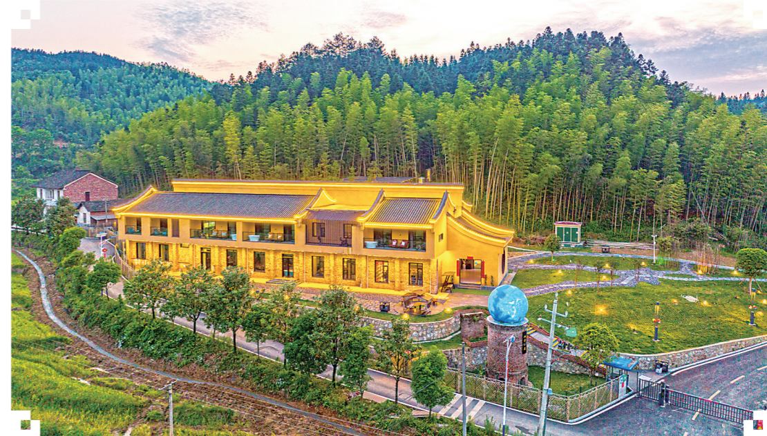
▲桃源山居外景图。