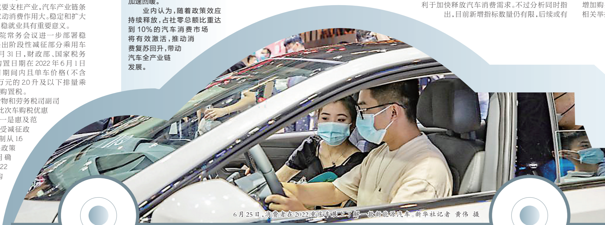
6月25日,消费者在2022重庆车展上了解一款新能源车。新华社记者 黄伟 摄

另据付一夫分析,汽车产业链条长,涉及原材料工业、设备制造业、配套产品业等多个领域,集成了大量高新技术。因此,提振汽车消费,也可以在很大程度上带动技术进步与产业升级发展。(据中新网)