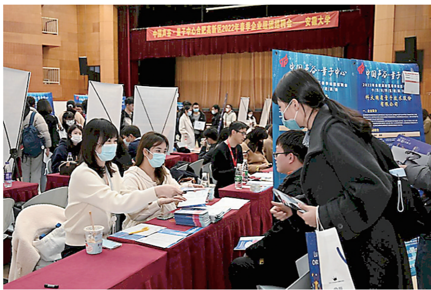
安徽大学招聘会现场。

值得注意的是,对于脱贫家庭、低保家庭、零就业家庭以及残疾、较长时间未就业等有特殊困难的未就业毕业生,各地还将组织党员干部、服务机构结对帮扶,制定“一人一策”帮扶计划。