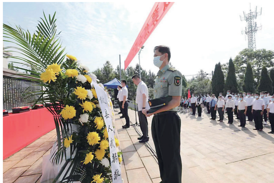
攸县烈士遗骸集中迁葬仪式。