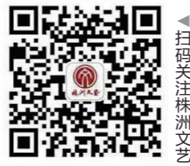
▲扫码关注株洲文艺