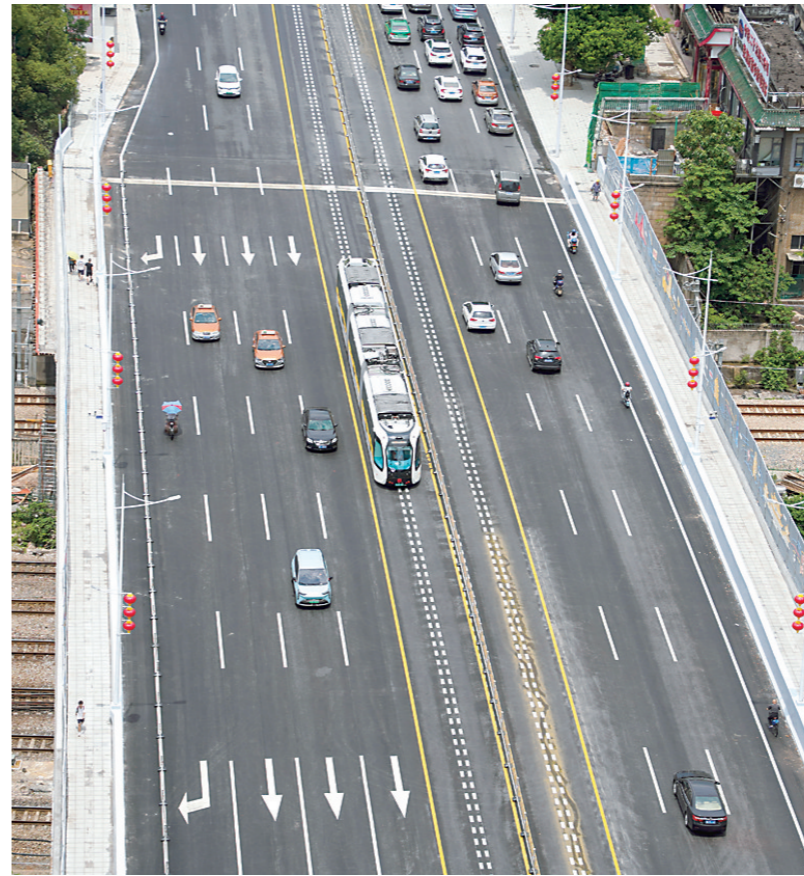
▲智轨列车驶过新华桥。

本报讯(株洲晚报融媒体中心记者/廖明 通讯员/殷滋)随着新华桥正式通车,7月1日起,公交快速廊道A2线,正式实现东西全线贯通运营。公交快速廊道A2线,起于天元区湖南工业大学站,止于荷塘区向阳广场站,全线总长11.6公里,西往东方向设站13座,东往西方向设站14座。廊道内通行常规公交以及智轨列车。