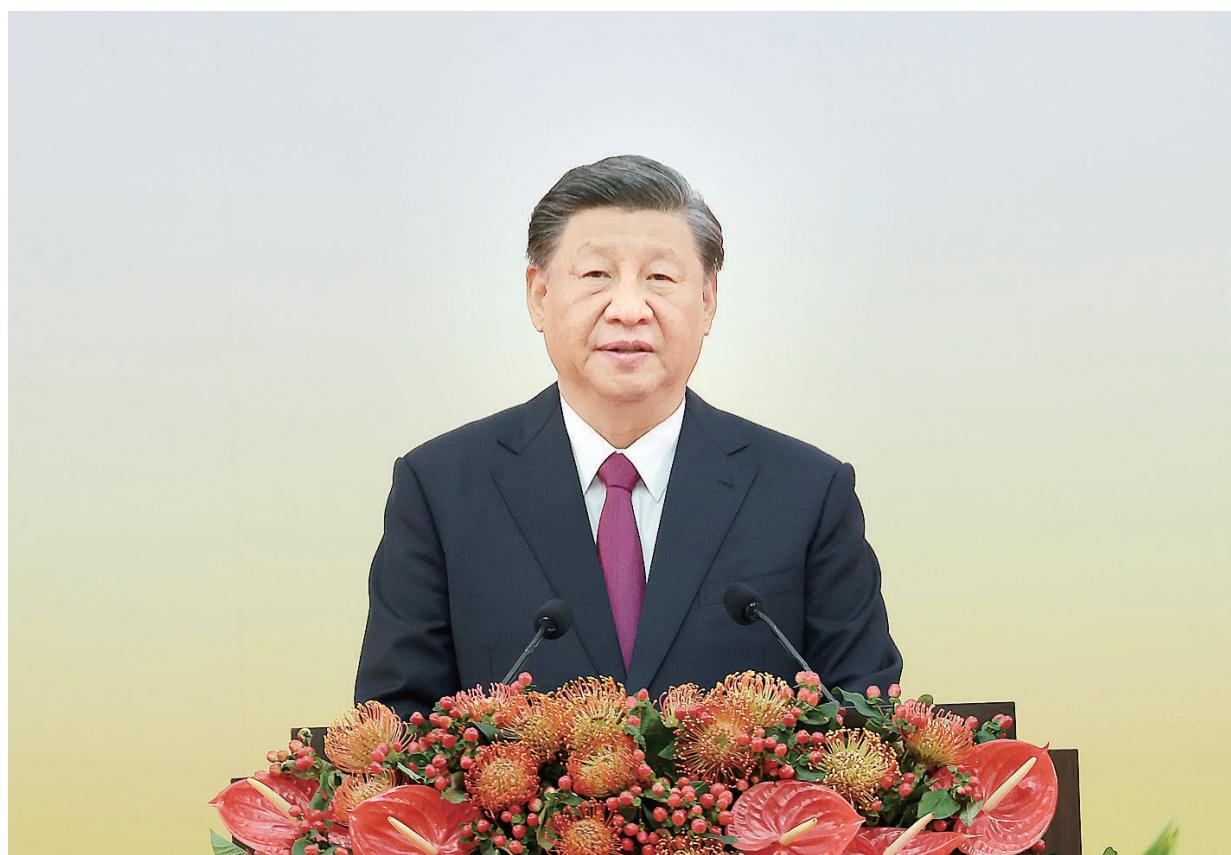
7月1日上午,庆祝香港回归祖国25周年大会暨香港特别行政区第六届政府就职典礼在香港会展中心隆重举行。中共中央总书记、国家主席、中央军委主席习近平出席并发表重要讲话。