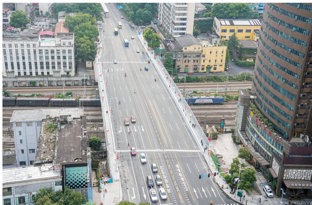
▲新华桥设双向8车道。