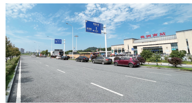
▲铁东路南段为双向6车道,设计速度60公里/小时。

本报讯(株洲晚报融媒体中心/张威)6月30日,随着最后一块围挡被撤走,铁东路南段正式通车。