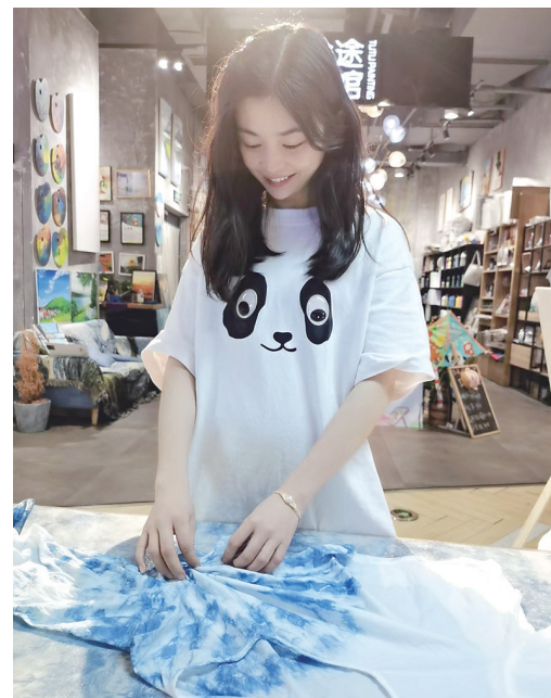
▲扎染爱好者体验扎染。