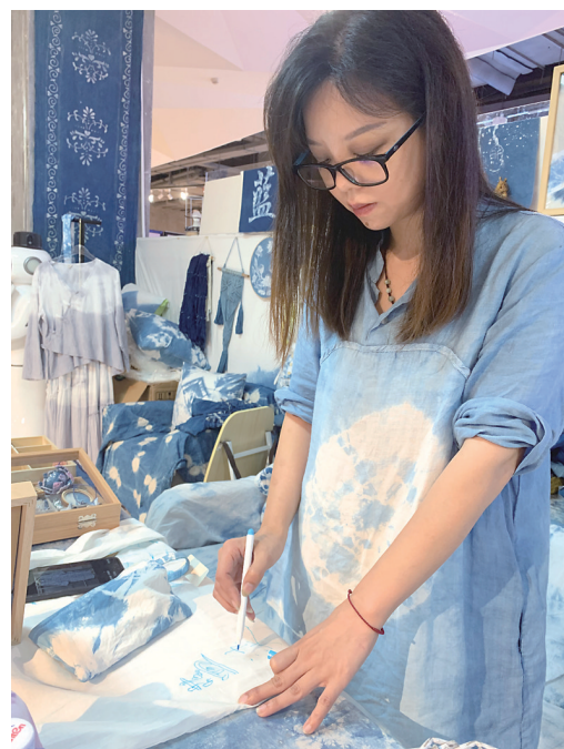
▲格格正在为扎染画草图。

从纯白质朴,到五彩斑斓或蓝白相间,扎染的魅力大概就在于,每一朵花形、每一条线段、每一个图案都像谜底,要一步步通过流程去慢慢揭开。