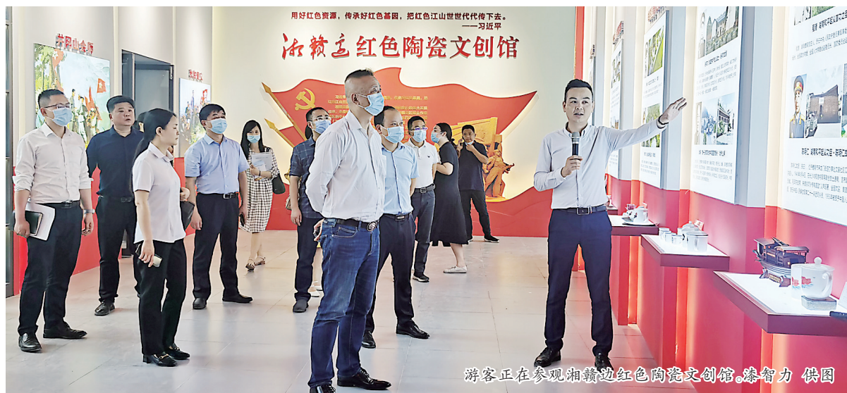
游客正在参观湘赣边红色陶瓷文创馆

尚方窑相关负责人介绍:“开馆一年,接待游客5万多人次,反响非常好。”记者看到,馆内由湖南农运历史丰碑醴陵、湘赣边革命纪念馆、红色文创陶瓷作品三部分构成。红星、党旗等元素与瓷杯、瓷盘、瓷书签等一件件精美的红色陶瓷产品完美融合,构成了生动的湘赣边革命历史画卷。