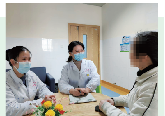
▲临床心理科专家为病患进行心理咨询。

青少年的成长困惑、女性更年期的烦恼、老年人的孤独与迷茫、成年人的焦虑与愤怒……这些都属于心理问题,当心理问题严重就会发展成为精神疾病。在株洲市三医院精神科,来寻求帮助的患者越来越多。医院临床心理科与心理咨询中心开展以药物、心理、物理、工娱、社会功能康复等多元化相结合的特色治疗,为越来越多有心理困惑的市民带来了福音。