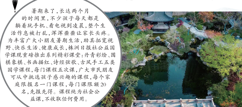
▲上课地点建发央著。