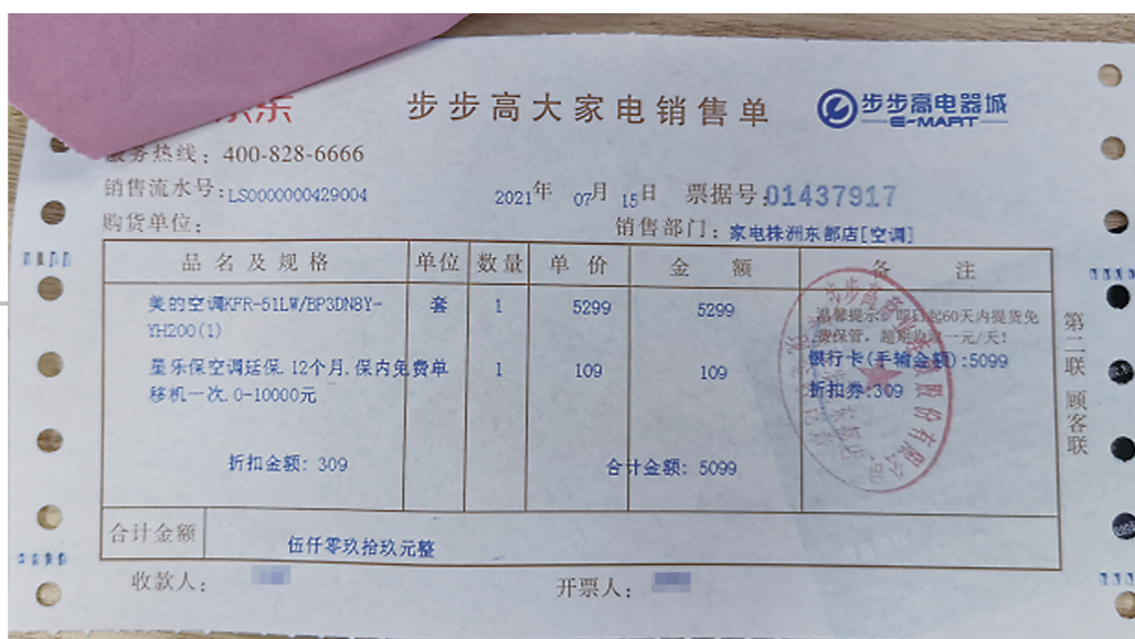
▲刘女士出示的购买凭证。