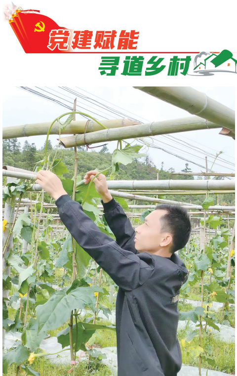
村民正在查看棚内丝瓜。