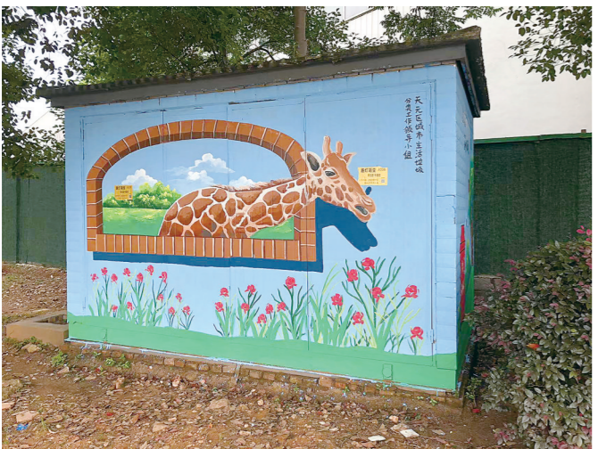
黄河北路上,一个穿上漂亮“花衣”的设施箱。

目前,天元区城管部门率先对辖区黄山路、衡山路、株洲大道等路段的90余个公共设施箱进行彩绘“涂鸦”,绘画内容包括我市的优势产业、城市文化符号、英雄及抗疫人物、旅游景点等,“涂鸦”面积约1000平方米。