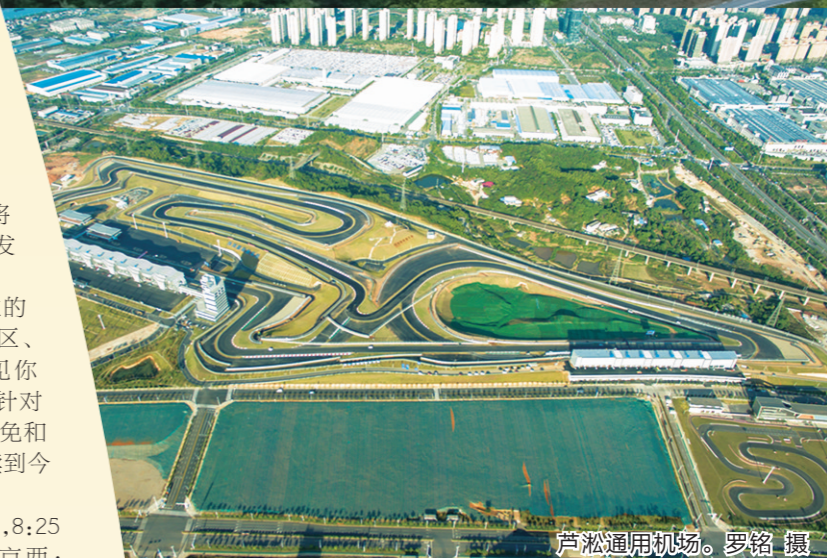
芦淞通用机场。