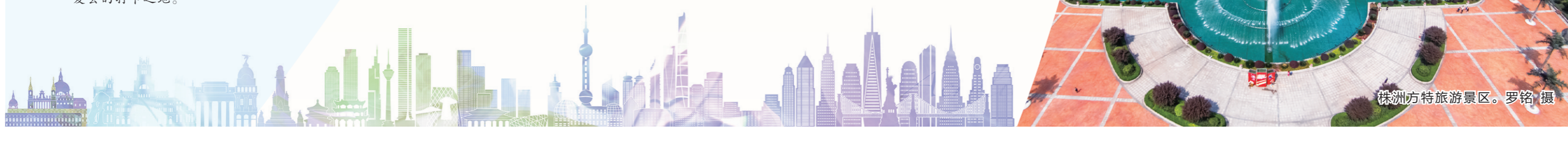
株洲方特旅游景区。

中奖名单将会通过“文旅株洲”公众号发布,获奖乘客凭车票和身份证在7月30日之前到市文化旅游广电体育局CS06(湖南省株洲市天元区联谊路鼎城大厦)领取奖品,过期作废。