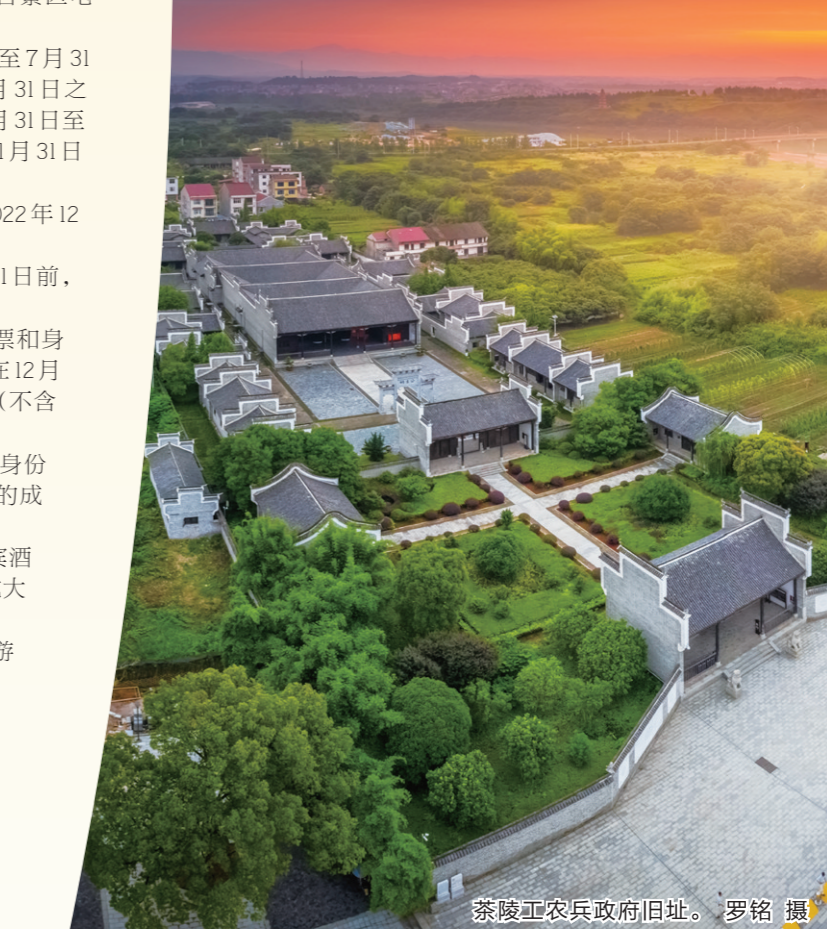
茶陵工农兵政府旧址。