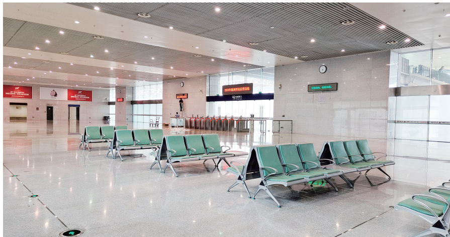
▲株洲西站一楼候车大厅已摆放部分座椅,1号检票口的检票设备也已安装到位。

本报讯(株洲晚报融媒体记者/廖明) 6月20日,武广株洲西站将作为始发站,开行往北京、上海方向的高铁列车。6月17日下午,记者登录中国铁路12306查询发现,株洲西往返北京西、上海虹桥的高铁车票已经开售。