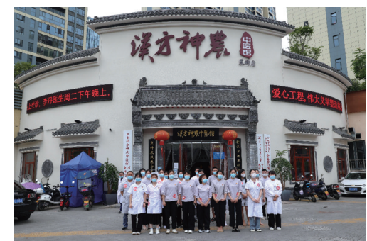
▲部分参赛选手合影。

为进一步提升中医药专业技术人员服务水平,提高中医药人员专业技能,加快培养中医药人才队伍建设,推动传统中医药事业的发展,6月16日,湖南汉方神农中医馆第六届“神农杯”中医药技能大赛在栗雨馆正式开赛。