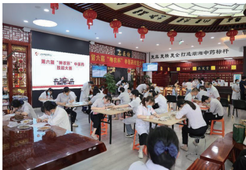
▲参赛选手比赛掠影。

鉴药材、看药方、抓中药……这些都是药剂师的工作日常。一双火眼金睛,通过口尝鼻嗅、手摸眼观,能从上百味药材中分辨优劣真假;他们对中药如数家珍,能准确辨别每一味药材的名字和功效;一把戥子秤是他们施展“功夫”的武器,一方调剂台是他们展现“技能”的舞台。从一张处方到一包中药,他们发挥着至关重要的作用。